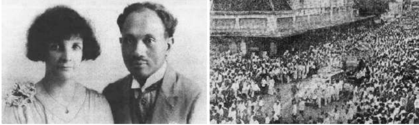
Foto 2: Dokter Soetomo dengan Istri (Kiri) dan Prosesi Pemakaman Dr. Soetomo (Kanan)

Sumber: Dokter Soetomo . Diakses dari http://www.imexbo.nl/dokter-soetomo.html . Tanggal 23 Maret 2017. Pukul 21.17 WIB.